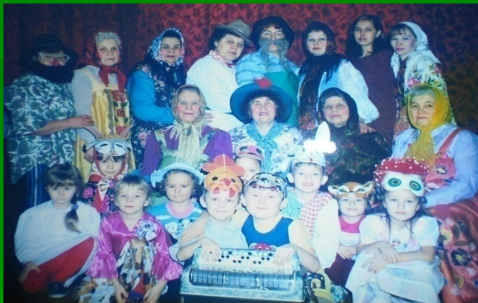
«Колядки» - на зимние святки...

ПОЗДРАВЛЯЛИ ВЕТЕРАНОВ ВЕЛИКОЙ ОТЕЧЕСТВЕННОЙ ВОЙНЫ