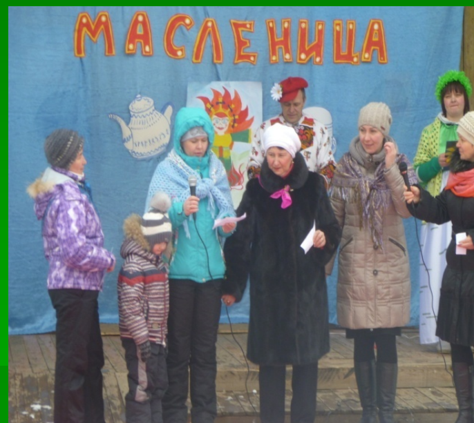
«Ой ладушки - лады – широкая масленка»